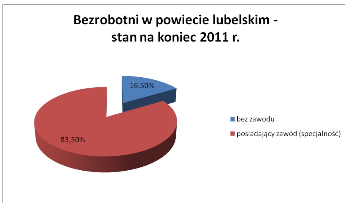
Wykres 1. Struktura bezrobocia w powiecie lubelskim w 2011 roku.

Jak wynika z powyższej tabeli spośród osób zarejestrowanych w PUP Lublin największą grupę stanowiły osoby bez zawodu (16,5 %). Grupa „bez zawodu” obejmuje osoby z wykształceniem gimnazjalnym i poniżej oraz posiadających wykształcenie średnie ogólnokształcące nie poparte żadnymi kwalifikacjami zawodowymi, dyplomem uprawniającym do wykonywania zawodu lub doświadczeniem zawodowym. Osoby z tej grupy mają utrudnione wejście na rynek pracy.